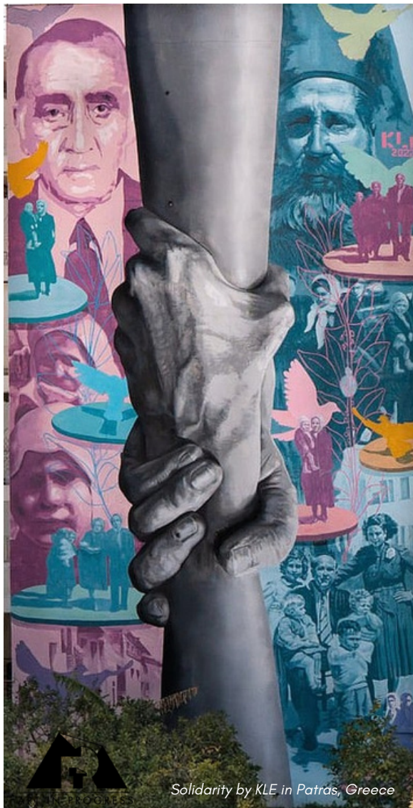
Solidarity by KLE in Patras, Greece